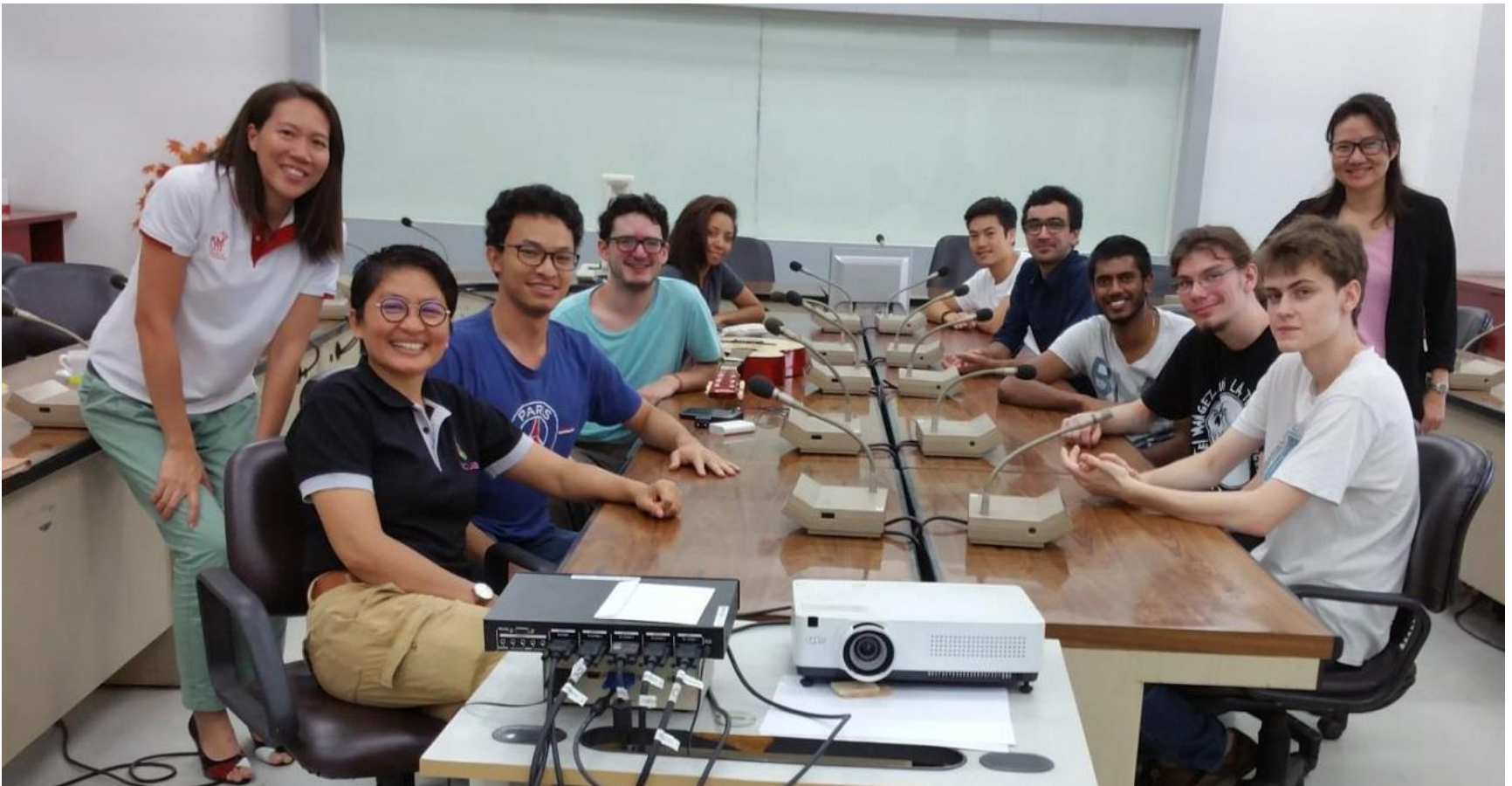
Etudiants ESIEA en stage technique à KMUTT